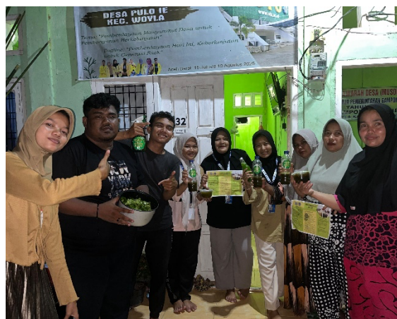
Gambar 3. Produk Pestisida Nabati Daun Pepaya

Setelah praktik selesai, dilakukan evaluasi untuk mengukur peningkatan pengetahuan dan keterampilan peserta. Hasil evaluasi menunjukkan adanya peningkatan yang signifikan, baik pada aspek pengetahuan maupun keterampilan. Tingkat pengetahuan rata-rata peserta meningkat dari 40% sebelum pelatihan menjadi 85% setelah pelatihan. Pada aspek keterampilan, kemampuan peserta dalam pembuatan dan aplikasi pestisida nabati meningkat dari 70% menjadi 90%. Hal ini membuktikan bahwa metode pelatihan yang diterapkan efektif dalam meningkatkan kapasitas masyarakat, baik dari sisi pemahaman konsep maupun keterampilan teknis.