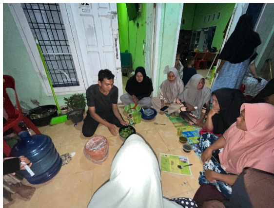
Gambar 2. Proses Pembuatan Pestisida Nabati Daun Pepaya

Pada sesi praktik, peserta dilatih membuat pestisida nabati di depan masyarakat dari daun pepaya melalui metode sederhana, yaitu dengan menghaluskan daun pepaya menggunakan blender/chopper , kemudian menyaringnya hingga diperoleh larutan siap pakai. Larutan tersebut dapat langsung diaplikasikan pada tanaman pekarangan seperti cabai, tomat, dan terong tanpa melalui tahapan fermentasi. Namun, apabila ditambahkan bahan tambahan seperti EM4, diperlukan proses fermentasi kurang lebih selama satu minggu. Proses pembuatan pestisida nabati ditampilkan pada Gambar 2, sedangkan Produk Pestisida Nabati Daun Pepaya yang dihasilkan ditunjukkan pada Gambar 3.